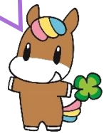
練馬区社協キャラクター ネリ

豊玉障害者地域生活支援センターきらら は、障害のある人たちやその家族が地域で孤立せず、安心して自分らしくいきいきとした生活が送れるように一緒に考え、サポートするところです。