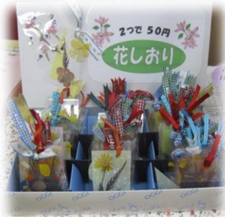
押し花しおりも 販売しました。

11月6日(日)は商店街主催の「チルコロ石神井」が開催され、ういんぐは「駄菓子詰め放題」をメインに出店しました！少し肌寒い1日でしたが、たくさんのメンバーと子どもたちがやって来てくれました。お手伝いのメンバーも多く、お客さんたちに笑顔で接客をしている姿が見られました。お金と駄菓子用袋の受け渡し、駄菓子の補充、呼び込み、小さなお子さんへの駄菓子を詰める手伝い、ういんぐのチラシとティッシュを配る係などなど…それぞれの役割を無理のない範囲で行いました。手作りの押し花しおりとネリーグッズも店頭に並びました。次回は3月の予定です。どうぞお楽しみに！