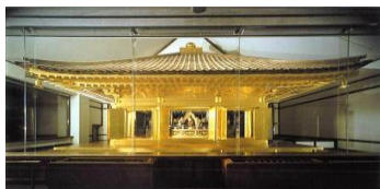
岩手県平泉の金色堂

小笠原諸島は、外来生物の除去が、課題として挙げられていて、それが改善されたため推薦にいたりました。富士山もゴミの不法投棄などの問題が改善されれば、登録の可能性が高いようです。