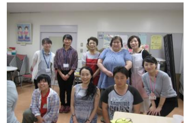
みんな自信がたった感じ