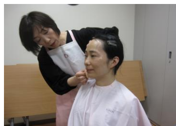
実際にメイクを体験