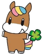
練馬区社協キャラクター ネリー

スイカやトマトなどのみずみずしい夏野菜は夏バテ防止にピッタリです！おいしいですが食べすぎには注意しましょう！