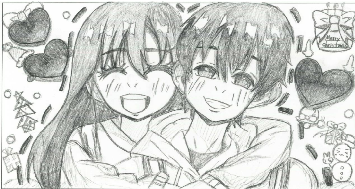
▲ 12月のイラスト：ボランティアのイーブイさんが描いてくださいました

今年もたくさんの素敵な出会いに恵まれ、地域のあちこちで笑顔が広がる一年となりました。なかでも、未来を担う若い世代の皆さんの活躍が、ひととき印象に残っています。そんな一年の締めくくりとして、特集では、若者たちが自ら立ち上げた「中高生のための居場所づくり」の取り組みにスポットを当てます。