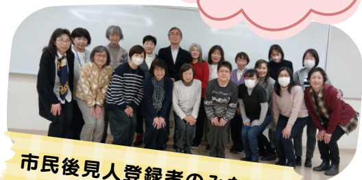
市民後見人登録者のみなさん

練馬区では毎年、市民後見人の養成研修を行っており、今回は令和8年度の第21期研修生を募集します。